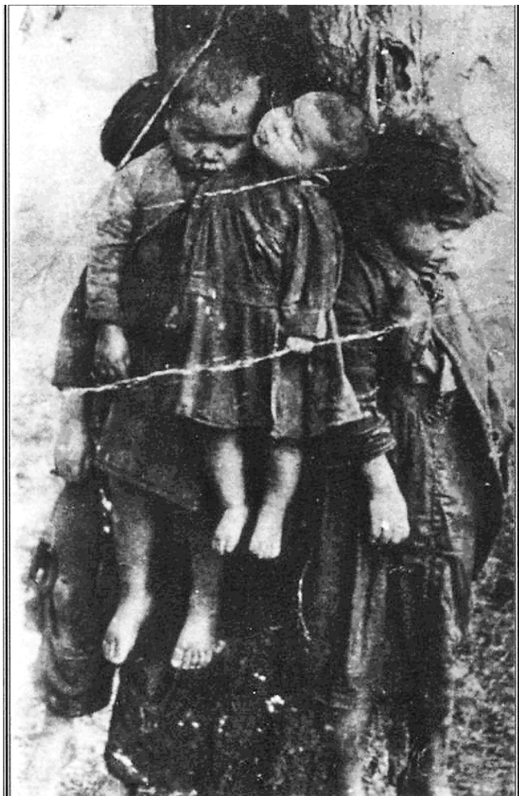
Тернопольская область, 1943 (?). Одно из деревьев просёлочной дороги, над которой боевики ОУН-УПА повесили транспарант с надписью в переводе на польский: «Дорога к независимой Украине». На каждом дереве палачи создавали из польских детей так называемые венки.